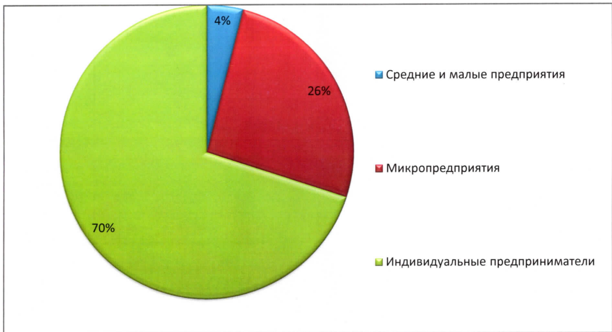
Рисунок 1 – Структура субъектов МСП на 10.01.2023

Основную долю в составе субъектов МСП занимают индивидуальные предприниматели – 70 %, микропредприятия составляют 26 %, средние и малые предприятия – 4 %.